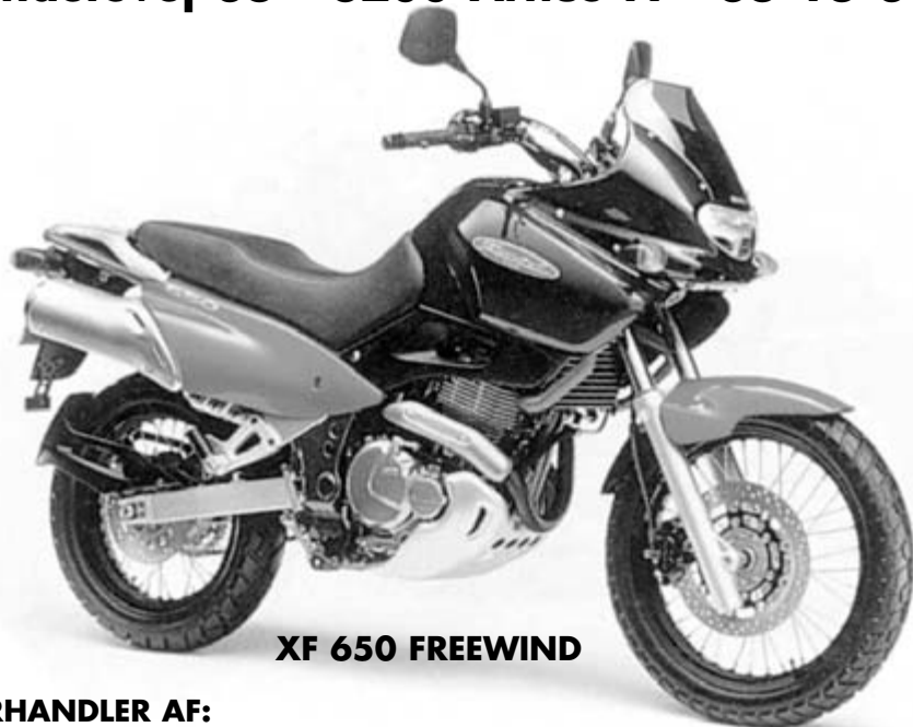
XF 650 FREEWIND

Randersvej 36 - 8200 Århus N - 86 16 33 96