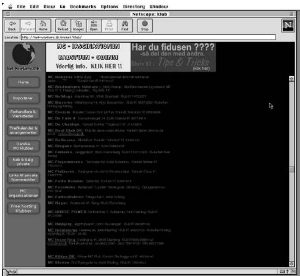
Her er så en side med klubber, vi figurerer selv med adresse og telefonnumre.

Som man kan se på den følgende side er der mulighed for at få vor egen hjemmeside.